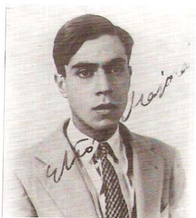
Tre ritratti di Ettore Majorana. (Riproduzione vietata)